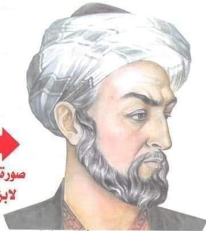
صورة تخيلية لابن سينا

بحث بن سينا كما بحث بن الهيثم في سبب تكون الجنين وعلته تكونه في الرحم ذكراً كان أم أنثى وعن خروجه من الرحم، وتشريح جسم الإنسان، والعظام، والفم، والغضاريف، والأنف وغير ذلك. اكتشف بن سينا سبب الطفيليات المعوية كالديدان المستديرة ووضعها بدقة في كتاب القانون وهي التي تُسمى حديثاً (الأنكلستوما)، وبين أنها تُسبب داء اليرقان. ووصف السل الرئوي وبين أن عدواه تنتشر عن طريق الماء والتراب ووصف الجمره الخبيثة (الفيالريا). وقد درس الحواس وبين ارتباطها ومكانها في الدماغ، كما استفاض في موضوع العين وكيفية الإبصار والرؤية.