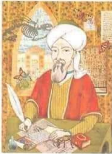
رسم تخيلي لابن سينا وهو يقوم بكتابة كتاب القانون في الطب

انتقل ابن سينا مع أهله إلى بخارى بأوزبكستان حالياً ليدير أبوه بعض الأعمال المالية للسلطان؛ ختم القرآن وهو ابن عشر سنين، وتعمق في العلوم المتنوعة من فقه؛ وأدب؛ وفلسفة؛ وطب. بقي في تلك المدينة حتى بلوغه العشرين ويذكر أنه عندما كان في الثامنة عشر من عمره عالج السلطان نوح بن منصور من مرض احتار فيه الأطباء، ففتح له السلطان مكتبته الغنية مكافأة له. وانتقل لخورزم حيث مكث أكثر من عشر سنوات، ومنها لجرجان فإلى الري وبعد ذلك رحل لهمذان وبقي فيها تسع سنوات ومن ثم دخل في خدمة علاء الدولة بأصفهان. وهكذا أمضى حياته متنقلاً حتى وفاته في همذان، في شهر شعبان من عام 427هـ. وقيل أنه أصيب بداء ( القولنج ) بآخر حياته. وحينما أحس بدنو أجله؛ اغتسل وتاب وتصدق وأعتق عبيده.